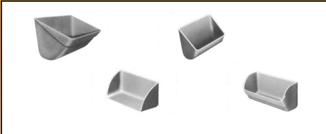
GODETS COULÉS - CAST BUCKETS